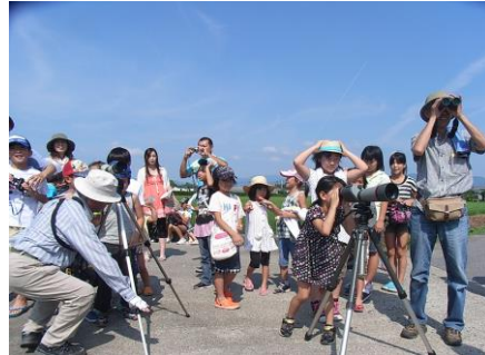
↑ 子どもたちの野鳥観測