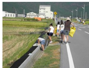
↑ 空き缶・ゴミ拾い