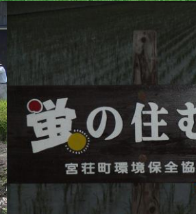
↑ 蛍の住む川づくり(H19・3年目から蛍が飛び交う)