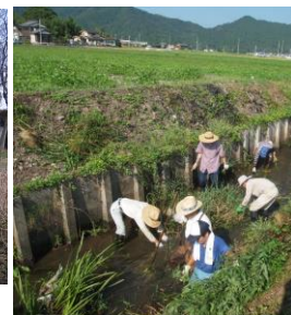
↑ 宮荘川の清掃 路肩