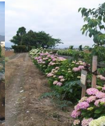
中卒生記念植樹の