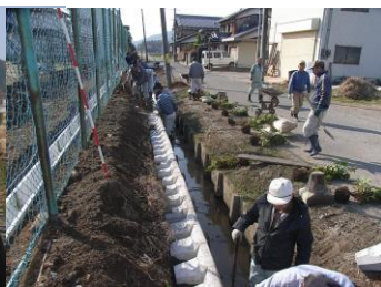
法面補強工事・つつじの植栽↑