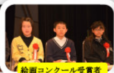
絵画コンクール受賞者