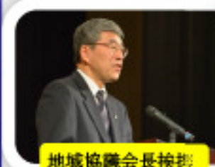
地域協議会長挨拶

平成27年2月8日(日)13時から、近江八幡市の男女共同参画センターで約230名の方にご参加いただき、『人・生きものにぎわう農村フォーラム2015』を開催しました。たくさんの方のご参加ありがとうございました。