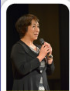
森さんの基調講演

〒521-1224 東近江市林町601番地 水土里ネット滋賀内 電話 0748-42-4806 FAX 0748-42-5574 Email: kyougikai@shiga-nouson-marugoto.co.jp