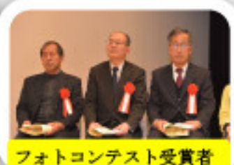
フォトコンテスト受賞者