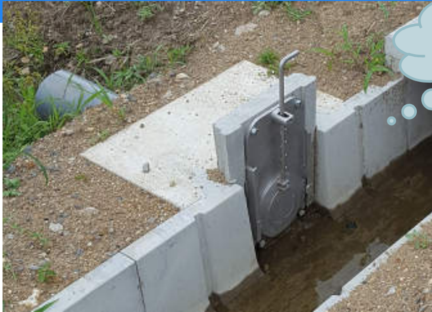
ほ場への 手上式取水ゲート