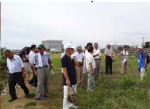
箸墓古墳周辺での説明