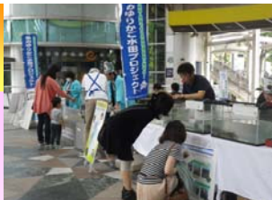
オープニングイベント (H25. 6. 1~2)