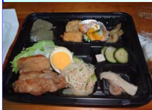
天理観光農園での昼食

【南檜垣の農地・水保全活動の紹介（活動組織代表）】「30数軒で18haほど耕作しています。機械はトラクターしか持たず、JAのリース事業で機械を借りることでリスクを減らしています。省力化し、農地を少人数で守る。儲けよりリスクを少なくするよう心がけています。