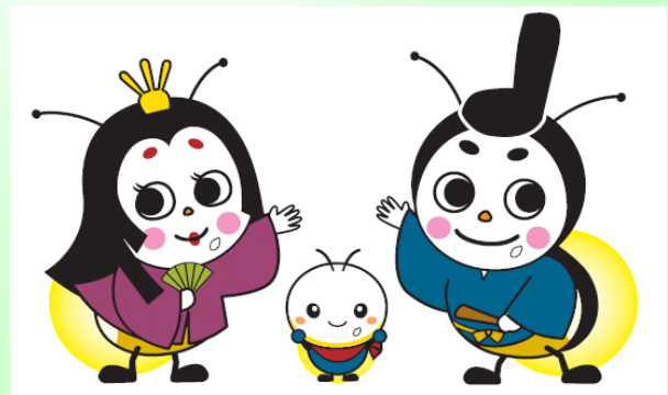
【米原市シンボルキャラクター】

このように、「山室保全会」の皆様におかれまして、地域の特色を活かしなが、様々な方と一緒に、地域をまるごと保全する取り組みに努められています。他にも、米原市内には、地域で丸となって、田園空間をまるごと保全されているお手本となるような活動組織がたくさんあります。最後に、農業者だけでなく、地域一丸となって、みんなで地域の自然が守られるような取り組みが広がることを期待しています。