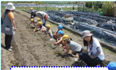
幼稚園児のコスモス種蒔

このように、少子高齢化が進む集落ですが、農地の保全、水環境保全等を農家・非農家・地域住民との連携、幼小学校(園)との交流をとおり一体となって我々が住む農村環境を守り、期待を抱いて次世代に引き継いでいくための息の長い活動を実施していきます。