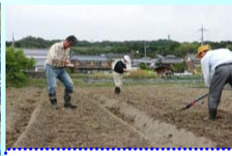
地域みんなでコスモス種蒔