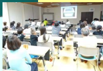
↓ホタル鑑賞会の様子