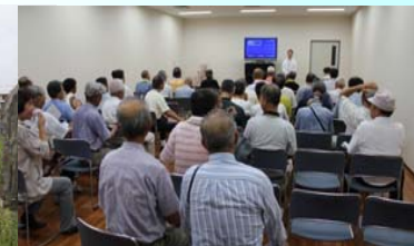
手延べそうめん製造工程説明