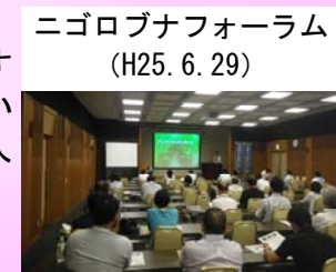
ニゴロブナフォーラム (H25. 6. 29)