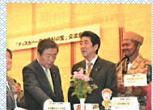
昨年度、首相官邸で開催された交流会の様子

農山漁村の持つ豊かな自然や食、産物など、埋もれていた資源の活用を行うことにより、都市と農村の交流、6次産業化、移住・定住の推進など農林水産業や地域の活力創造に繋がる取組について幅広く対象としています。