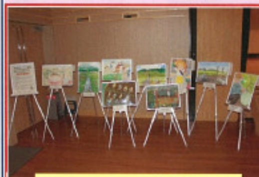
絵画コンクール受賞作品の展示

↑『田んぼ大好きふるさと農村子ども絵画コンクール』受賞作品9点を会場ホール内で展示し、たくさんの皆さんにご覧いただきました。