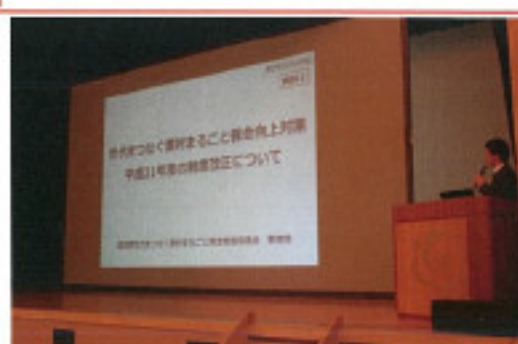
滋賀県世代をつなぐ農村まるごと保全推進協議会事務局の説明